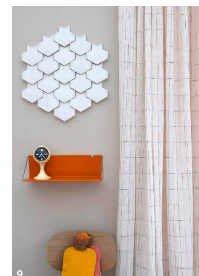
1 Behang KT2164 van Ronald Redding via De Mooiste Muren. Wandrek Utrecht DW 01 van Constant Nieuwenhuys, € 249, Spectrum. Geruite handdoek Odds & Ends € 10, Foekje Fleur. 2 Lamp Neuro Esthetische Kubus van Studio 23:23 verbindt design en neurowetenschappen, v.a. € 750. 3 Schilderij Sentir Bien van Sarah Lugthart, acryl op canvas, 63 x 83 cm, € 350, Lugth-Art. 4 Porseleinen haken Nosy van Studio Daphne Zuilhof, € 39 per stuk. Borden van Cor Unum. Theedoeken, katoen/linnen, 50 x 70 cm, € 25, Frohstoff. 5 Wasteboards skateboard van Sven Noordhoek van gerecyclede plastic doppen, 72 x 19 cm, € 299, Wastecraft. Sidetables Pattern Mist van Sven Noordhoek, gerecycled plastic en staal, € 999 per stuk, € 3750 per vier (Wastecraft). Tegel Flow rond hoofdinde, duurzaam beton in cloudy white, 10,7 x 24,7 x 3,8 cm, € 698 per m 2 , Novel Grey. 6 Spiegel van Jule Cats, 70 x 40 cm, € 2500. Wandtegels Pop Tile Ferus, geglazuurd, 15 x 15 cm, € 79 per m 2 , Cottoceramix. 7 Wandobject van Sofie Aaldering, tule, glasvezels en pompons, 120 x 83 x 25 cm, p.o.a. Behang Sculptura Oblong 42542 van Arte via De Mooiste Muren. 8 Kimono van Brigitte Vermeulen, katoen met wol, diverse maten, € 250, Social Label. Muurverf White Truffle no. 644, mat op waterbasis, € 51 per liter (LAB Paint). 9 Gordijn Plus van Inga Sempé, 300 cm breed, € 177 per meter, Kvadrat. Tegelobject Zenith van duurzaam beton in cloudy white, 14,7 x 14,7 x 2,8 cm, € 698 per m 2 , Novel Grey, warmwaterkruik € 38, Suite 702.